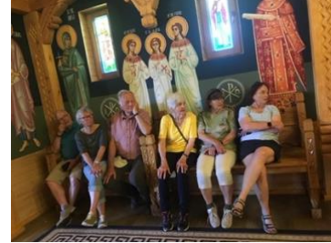
Schloss Clemenswerth und Schlossgarten mit alter Eibenhecke Rumänisch-Orthodoxe Kirche

Am nächsten Tag besuchte die Gruppe zunächst die neu am Ortsrand gebaute Rumänisch-Orthodoxe Holzkirche, in der die rd. sechstausend Rumänen der Umgebung ihre Gottesdienste feiern. Anschließend wurde auf Feldwegen gewandert und die alte, inzwischen verrostete, Transrapid-Teststrecke besucht. Die Wanderung am dritten Tag führte auf sehr schönen Wanderwegen durch Kiefernwälder. Die Strecke betrug zwölf Kilometer.